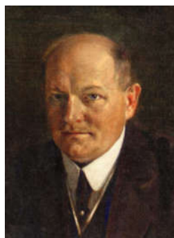
Emil Molt, fondateur de la première école Waldorf

En septembre 1919, Emil Molt réussit à fonder la première école Waldorf à Stuttgart. Cela n'est possible que parce que Rudolf Steiner, grâce à une lacune dans la loi, peut choisir ses enseignants en fonction de leurs capacités, sans qu'ils aient à suivre une formation pédagogique reconnue par l'État