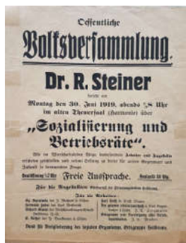
Rudolf Steiner, Assemblée populaire publique, thème « Socialisation et conseils d'entreprise »

Parallèlement, R. Steiner s'engage pour la formation de conseils culturels pour l'autogestion de la vie de l'esprit.